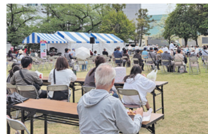
飲食を楽しみながらステージイベントを鑑賞

来場者は両日で約18,000人。天候にも恵まれ、買い物之余、キッチンカーで買った料理を片手に、屋外ステージのイベントや公園の体験コーナーなどを楽しむ様子が見られた。