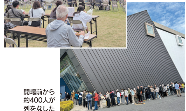
開場前から約400人が列をなした