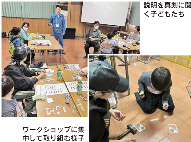
説明を真剣に聞く子どもたち

組合事務所内のものづくりミュージアムや組合員の工場を見学。キーホルダーを作成するワークショップも実施し、参加者は地域のものづくり企業の魅力に触れた。