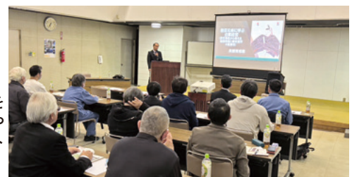
秀長の手腕を 題材に経営や マネジメント などを解説

現代の経営に通じるものがある部分として、①秀吉が自分の長所短所を自覚しそれを補える秀長を重用して適材適所・分業を徹底した点、②秀長が家臣に限られた原資をうまく配分したバランス感覚、③兄弟間で理念を共有できていた点、④信頼関係に基づいた諫言などを解説した。