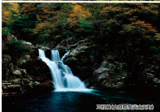
三段滝(山県郡安芸太田町)