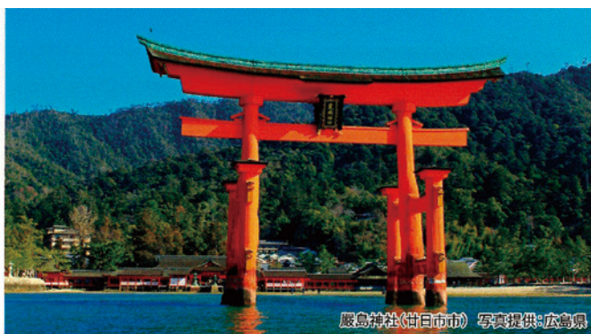
厳島神社(廿日市市)