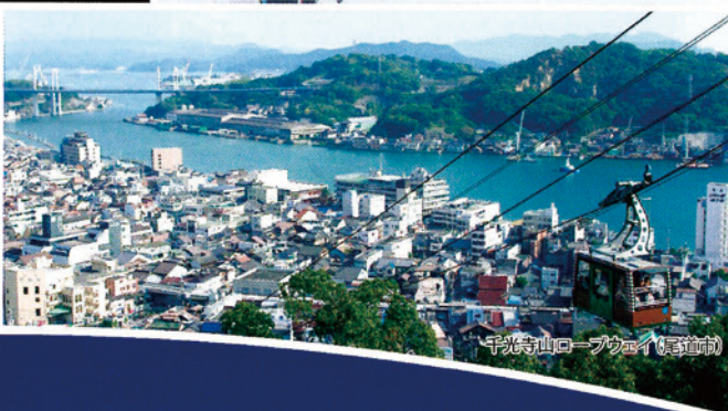
千光寺山ロープウェイ(尾道市)