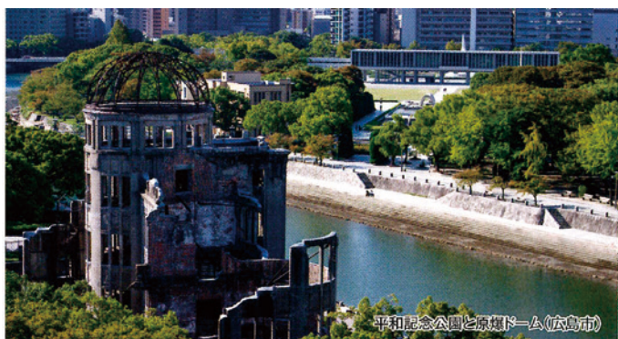
平和記念公園と原爆ドーム(広島市)