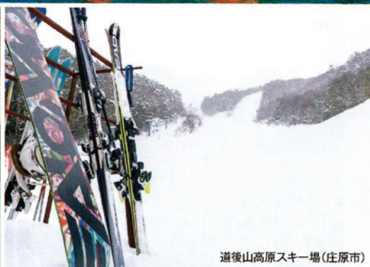
道後山高原スキー場(庄原市)