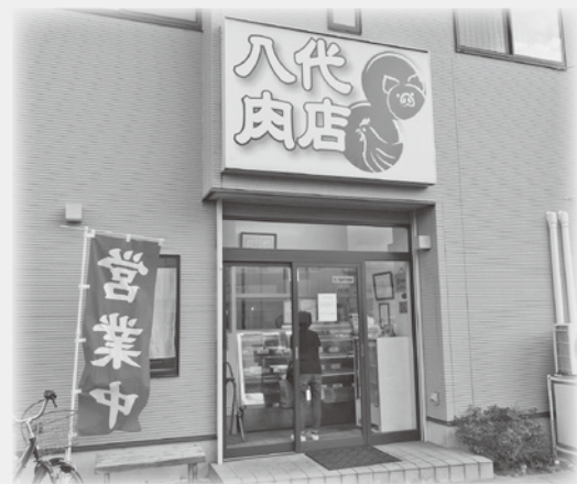
伊勢崎駅前の道路に面した店入口