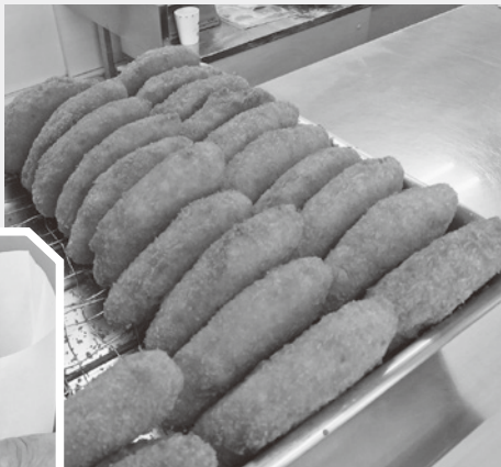
揚げたてのコロッケ