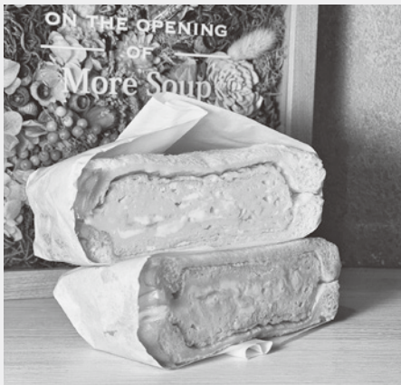
お店自慢のたまごサンド

材料はもちろん、素材本来の美味しさを感じてもらえるよう味にもこだわった、お店自慢の逸品です。(1日20個限定)