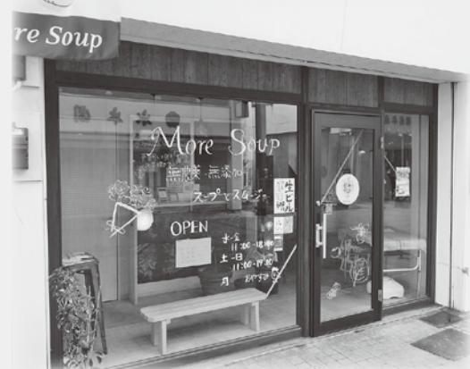
ガラス張りのお店は気軽に入りやすい雰囲気