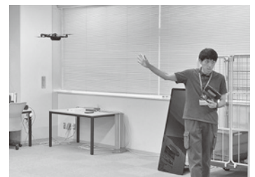
ドローンの飛行の実演を見学

また、中小企業のDX化の加速に役立つデジタルソリューション(5G・ロボット・IoT・AI等)を展示している群馬DSL(デジタルソリューションラボ)では、様々なデジタル技術に触れた。その場には実在せずゴーグルを通して写し出されたキーボードの画面操作を行うなど、様々なデジタル技術を体感。参加者からは、驚きの声が上がっていた。