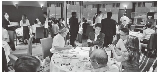
円卓を囲み交流を深める参加者