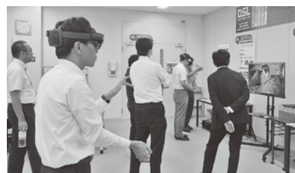
デジタルソリューションを実際に体験する参加者