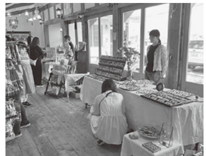
オープン後、初開催となったマルシェの様子

不動産業・建設業を営む株式会社ディーワイプランは、世界のお菓子を集めた「Biscotti SWEET CAFE(ビスコッティ スイート カフェ)」を高崎市のショッピングモールそばにオープンした。