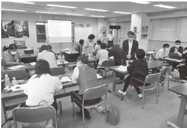
グループワークに取り組む参加者

なお、本ワークショップは今後3回開催することになっており、各旅館がSDGs宣言できるよう取組みを進めていく。