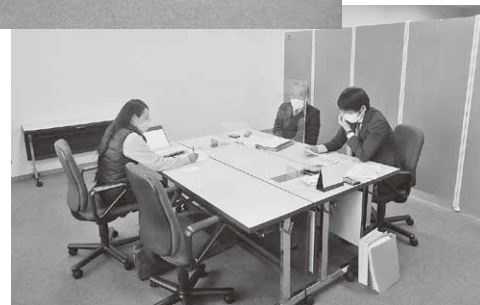
企業に寄り添った丁寧な説明が行われた