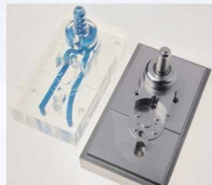
3Dプリンタ造形例 (金型の三次元冷却配管)