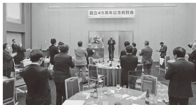
約2年ぶりの再会に、話が弾んだ