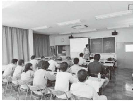
座学による講義の様子