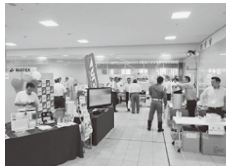
防犯カメラなど様々な防犯機器が展示された

本展示会は、日頃弱者を狙った事件・事故などが新聞やテレビなどで報道される中、そこには「防犯カメラ」の映像が利用されている現状を踏まえ、日々進化し、多種多様化している「防犯カメラ」の特徴・性能を紹介し、安全で安心なまちづくりを考えることを目的に開催された。