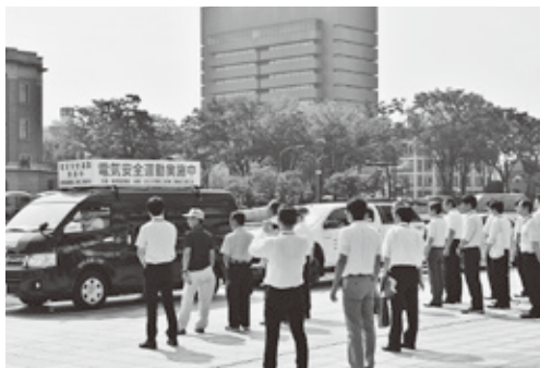
県庁を出発するキャラバン隊

当キャラバン隊は、8月を経済産業省が電気使用安全月間に主唱しているのに合わせ、一般家庭を主な対象に電気使用の安全に関する啓発を行い、不良電気設備の改修、一般用電気工作物の保安確保と電気災害の防止に資することを目的に毎年行っているもの。