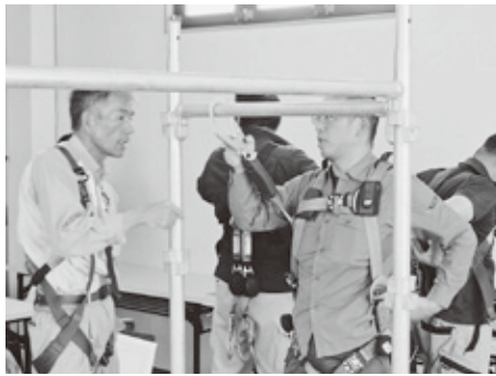
防護具を着用した実技講習

参加者は、関係法令や労働災害防止の知識等について座学にて講習を受けた後、実際にフルハーネス型墜落制止用器具を着用し、実技により、その使用方法などにつ