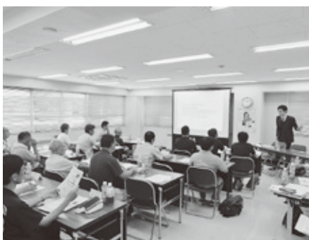
熱心に講師の説明を聞く受講者

※区分記載請求方式、インボイス制度などの詳細については、最寄りの税務署、本会などにお問い合わせください。