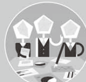
ワークショップ型

EdTech(テクノロジーを活用した教育技法)を活用し、時間や場所にとらわれない多様な学びのスタイルを提供します。※講義形式でのワークショップも選択できます。受講者の環境・状況に合わせた学習が可能です。